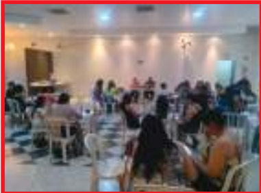
Presença das associadas durante o evento no Sindicato