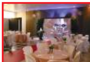
Salão Social decorado para Festa de Casamento

-SALÃO DE FESTAS: Informações na sede do Sindicato da Borracha, à Avenida 15 de Maio, nº 625 – Centro, Monte Alto.