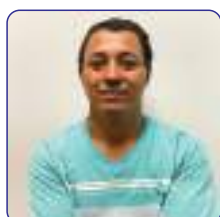
Juvenil F. de Oliveira Comercial - BMA