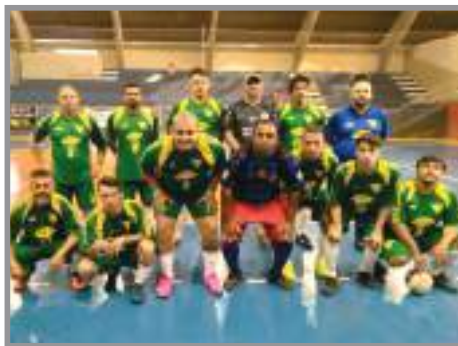
Equipe da BMA/GARFLEX, quarta colocada no Torneio