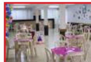
Salão Social decorado para Festa de Aniversário