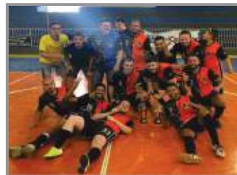
Equipe Fúria Negra, primeira colocada no Torneio