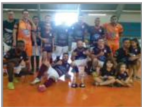
Equipe Unidos do Mé, segunda colocada no Torneio