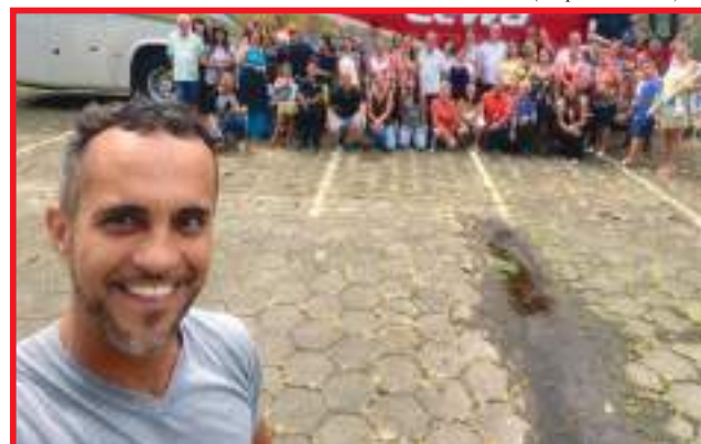
Participantes da segunda turma da viagem de 2022