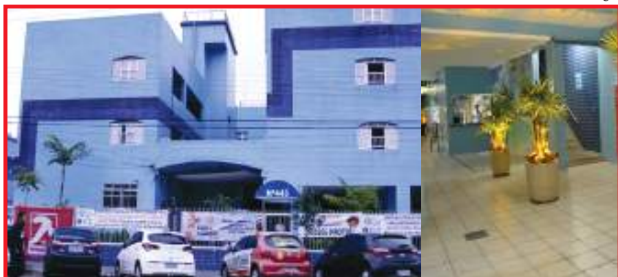
Colônia de Férias localizada na Praia Grande